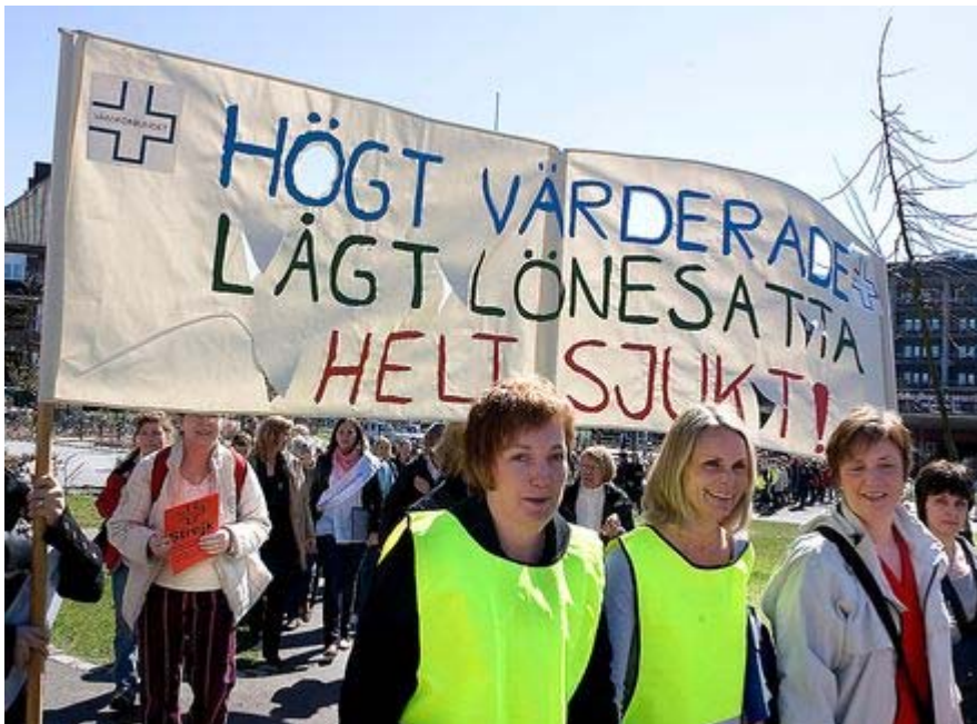
Strejkande sjuksköterskor vid Helsingborgs lasarett. 2008.